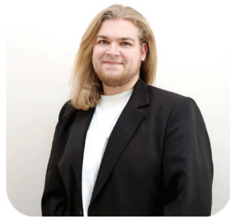
принимать его как нечто глубоко родственное. Мнения собирала Аlesia ДУБРОВСКАЯ.

Считаю, что очень важно сберечь свой национальный язык и передать его потомкам, потому, получив диплом ВГУ, хочу вернуться в Дагестан и помимо основной работы участвовать в мероприятиях по сохранению национальных языков.