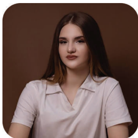
сии и связать с ней свою жизнь.

Считаю, что хорошим следователем может стать как мужчина, так и женщина. Главное – обладать такими качествами, как ответственность, целеустремленность, физическая выносливость и моральная устойчивость. Не менее важно иметь желание помогать людям и любить свою страну. Уверена, что за годы обучения в ВГУ я получу все необходимые знания, умения и навыки, которые позволят мне состояться в профес-