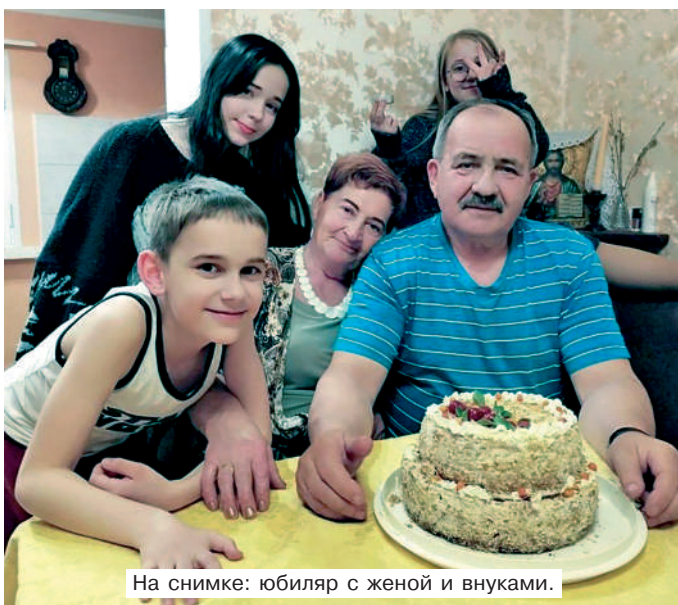
На снимке: юбилар с женой и внуками.

– Тогда в школе обучалось порядка 250 человек. Педагогический коллектив принял меня благосклонно, хотя мой достаточно юный возраст