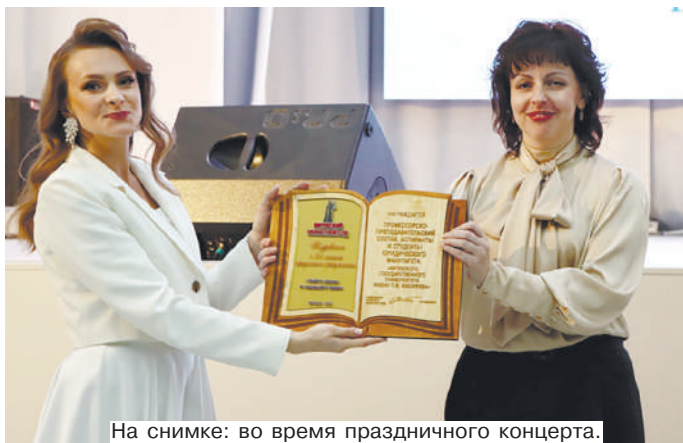
На снимке: во время праздничного концерта.

Накануне своего профессионального праздника дружная семья юридического факультета с размахом отпраздновала юбилейный день рождения – 25-летие. Безусловно, у всех, кто причастен к этой важной дате, после всех мероприятий, которые проходили в эти дни на базе нашего университета, остались только положительные эмоции и незабываемые впечатления.