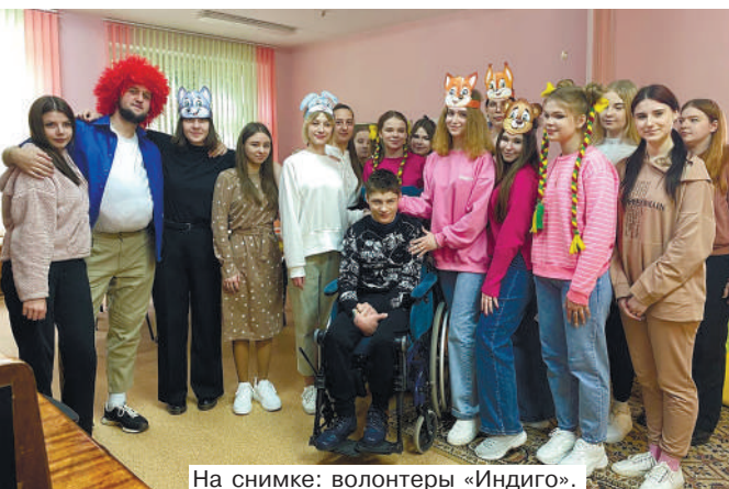
На снимке: волонтеры «Индиго».

Активно общаются с волонтерской деятельностью и студенты педагогического факультета, чтобы предоставить