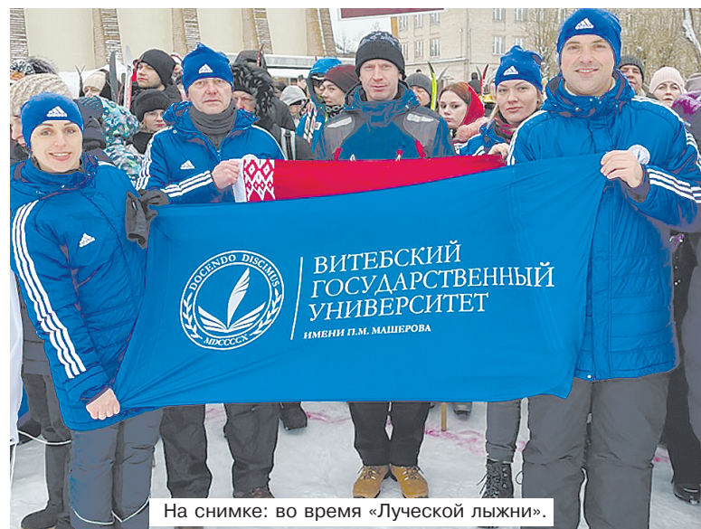
На снимке: во время «Луческой лыжни».

Всем известно, что движение – это жизнь. Именно поэтому студенты и преподаватели нашего университета всегда участвуют в различных спортивных соревнованиях. Ведь спорт укрепляет здоровье, формирует стремление всегда быть первым и умение преодолевать препятствия, а также ставить цели и достигать их. С наступлением весны я решила узнать о победах машеровцев за зимний сезон.