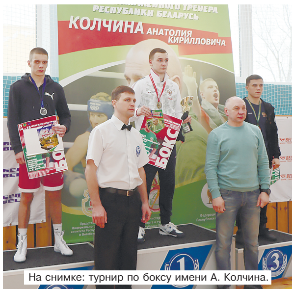
На снимке: турнир по боксу имени А. Колчина.