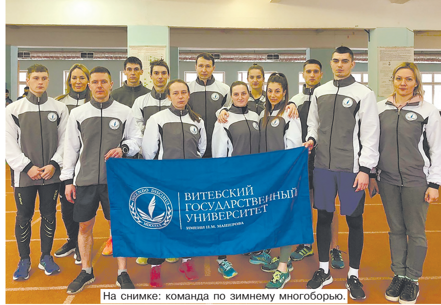
На снимке: команда по зимнему многоборью.