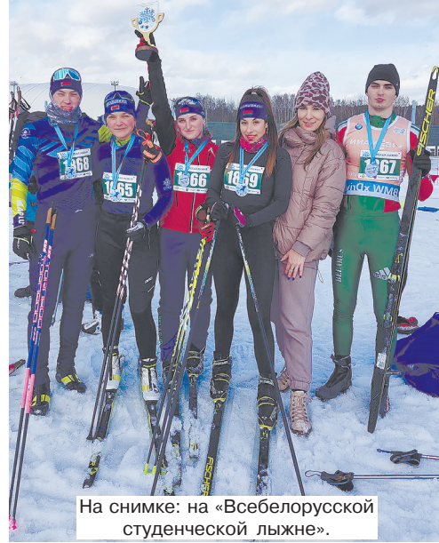
На снимке: на «Всебелорусской студенческой лыжне».