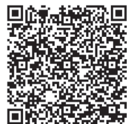
Фото- и видеорепортаж с церемонии закрытия смотрите с помощью QR-кода.