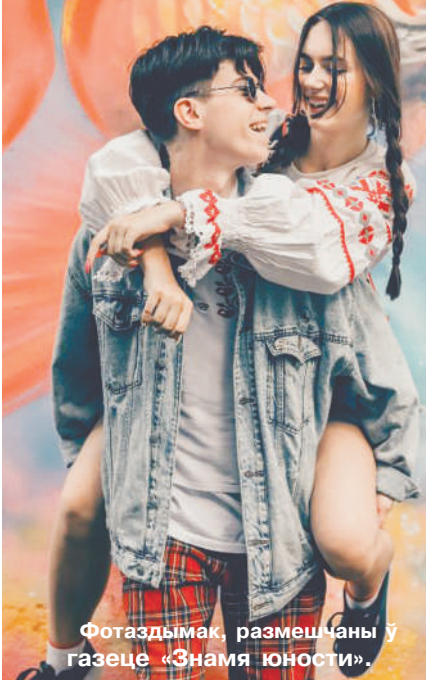
Фотаздымак, размешчаны ў газеце «Знамя юности».

«Галоўнае для мяне пасля знаёмства – усталяваць кантакт. Я заўсёды падбадзёрваю чалавека, якога збіраюся фатаграфаванне. Магу нават папрасіць уключыць яго любімую музыку, бо гэта расслабляе. Мне падабаецца працаваць