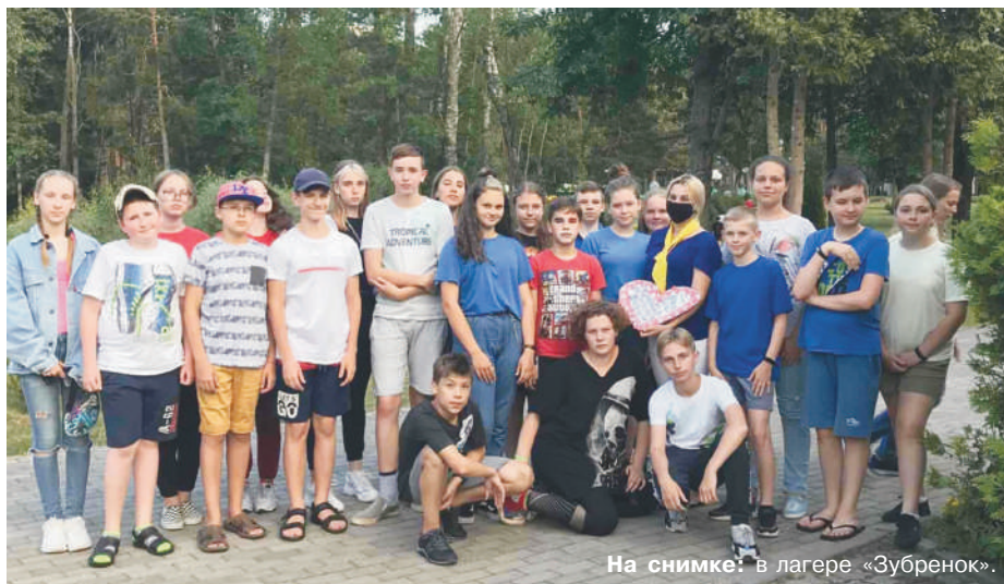
На снимке: в лагере «Зубренок».

Своими впечатлениями от практики в детских оздоровительных лагерях с нашей газетой поделились студенты.