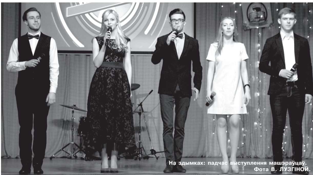
На здымках: падчас выступлення машэраўцаў.

Пад такім дэвізам праходзіў другі этап рэспубліканскага агляду-конкурсу мастацкай творчасці студэнтаў устаноў вышэйшай адукацыі «АРТ-вакацыі – 2018». У актавай зале Віцебскага дзяржаўнага тэхналагічнага ўніверсітэта сабралася каля 500 студэнтаў, магістрантаў і аспірантаў чатырох віцебскіх і полацкай ВНУ, каб пра-