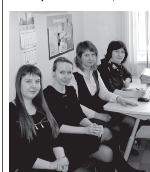
На снимке: рабочая встреча. Обсуждение проекта.

Безусловно, выпускников детских домов есть некоторые проблемы, связанные с успешной социализацией и адаптацией в обществе. Им не хватает определенных компетенций и навыков, а также знаний по вопросам брачно-семейных отношений.