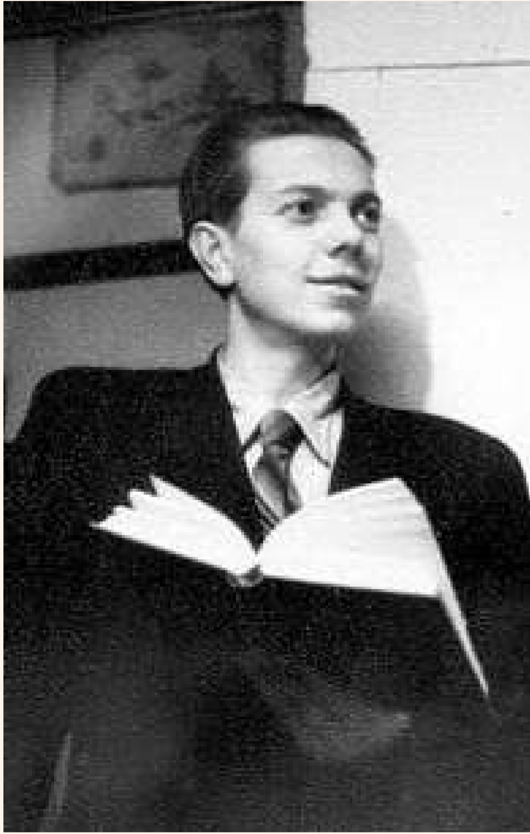
У. Караткевіч. 1950