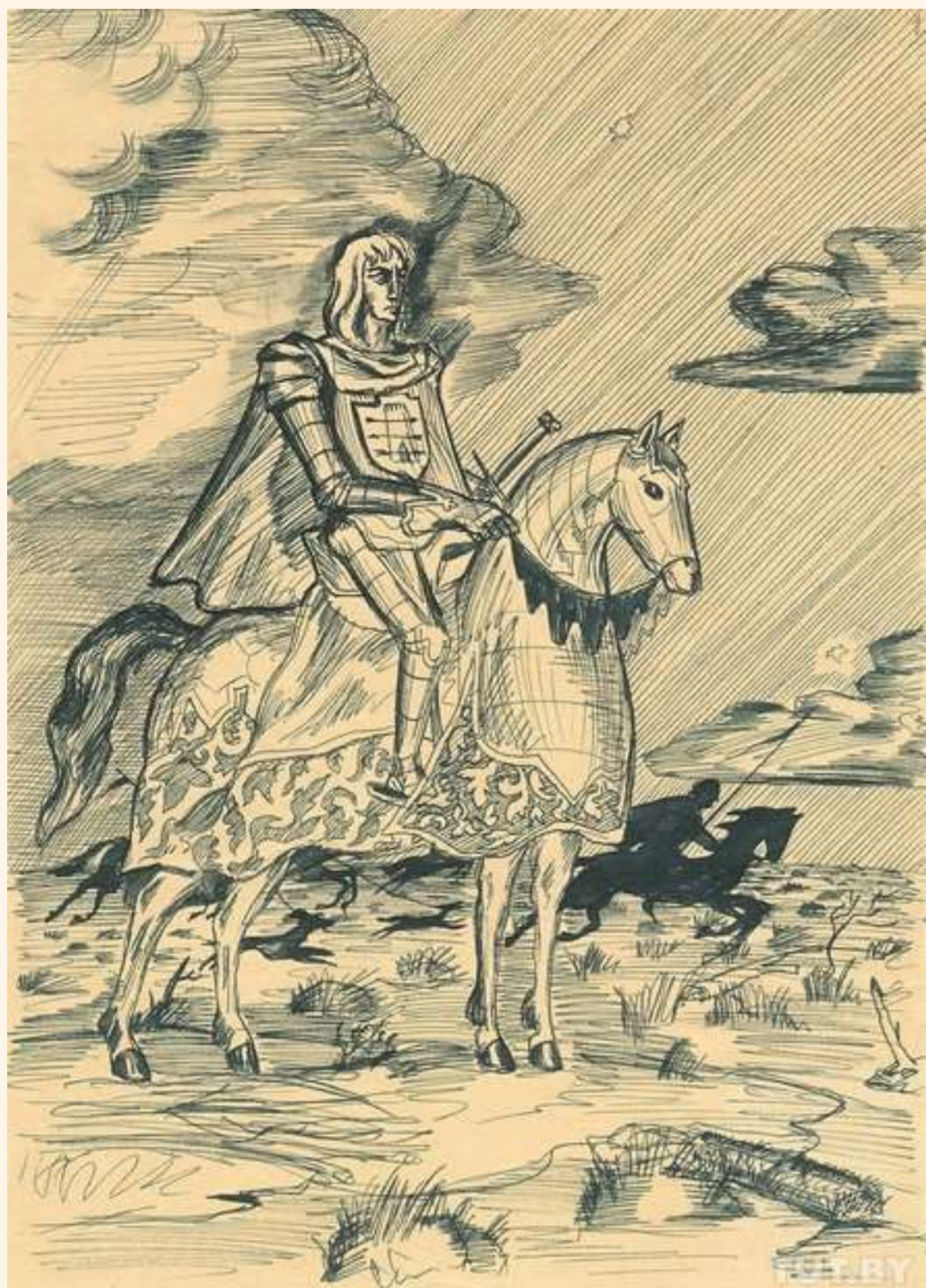
Малюнак, 1948 год. На адвароце Уладзімірам Караткевічам пазначана: «Маляваў, калі было год 18»

міўся з Караткевічам, калі той працаваў у архівах Вільнюса. Письменник пісаў пра сустрэчы з Шутовічам у сваім дзённіку. Згадваў яго як аднаго з захавальнікаў беларускай культуры ў Вільнюсе ў нарысе "Дружба навекі", падрыхтаваным для літаратурнага друку.