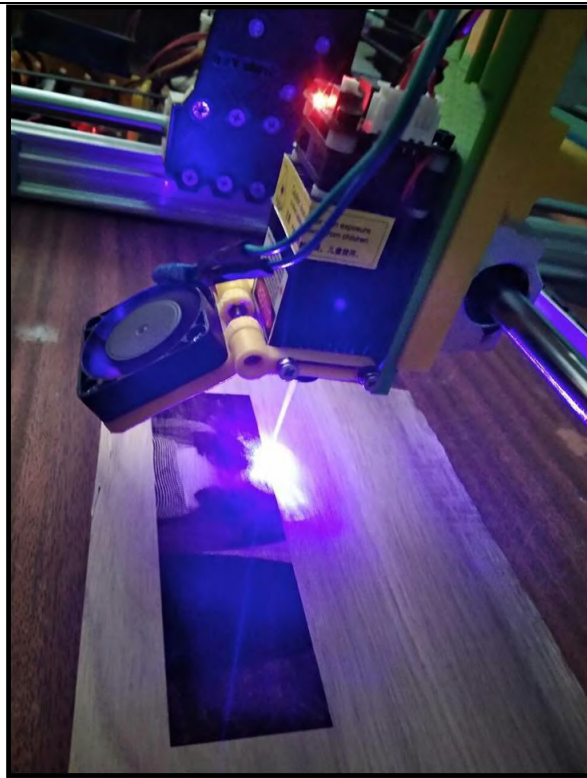
Рисунок 2 – Лазерный гравер в процессе работы