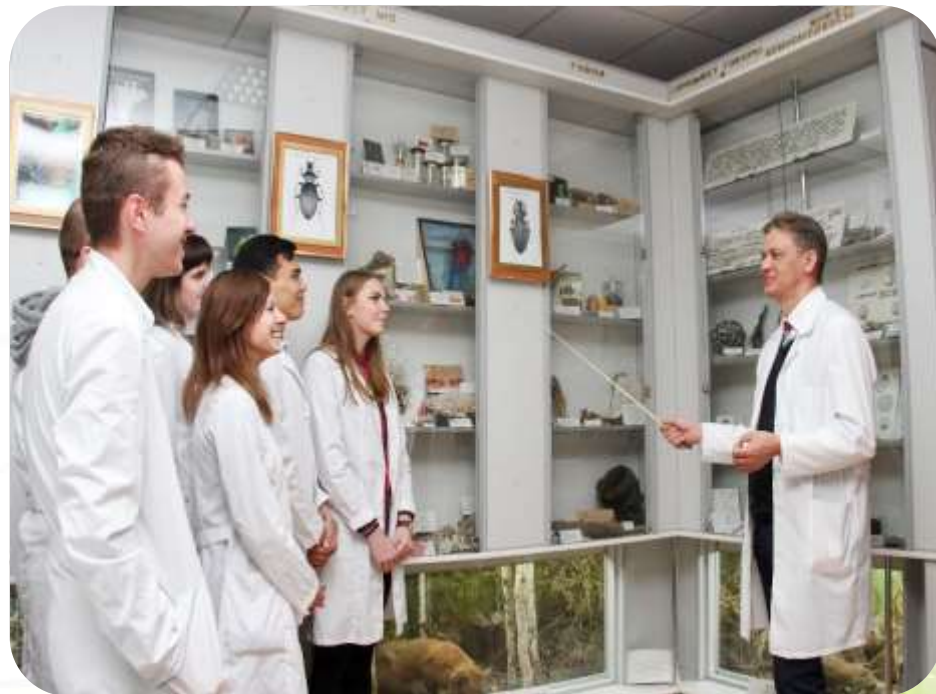
Музей биологического факультета